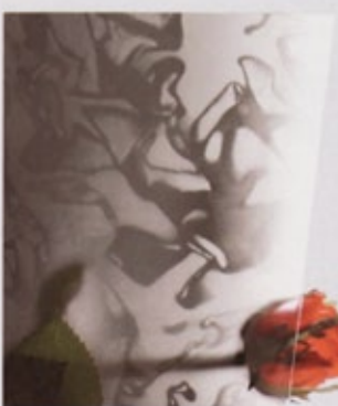
Madras Silk, geätzt (279)