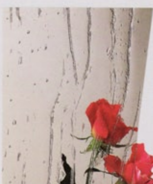
Ornamentglas Gotik bronze