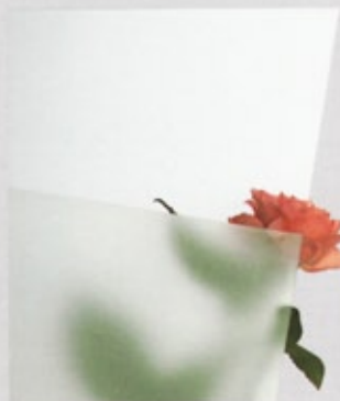
Float klar sandgestrahl (211)

Auf diesen beiden Seiten haben wir die wichtigsten Glassorten zusammengefaßt. Alternativ zu den abgebildeten Gläsern auf den Seiten zuvor können auch andere Gläser in Ihre Haustür eingebaut werden (längere Lieferzeit und anderer Preis). Wählen Sie selbst das Glas als Stilelement Ihrer Haustür aus. Obwohl verkleinert, zeigen diese Gläser dennoch wirkungsvoll den typischen Charakter der Strukturen und Ornamente.