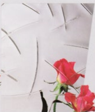
Ornamentglas Gußantik weiß