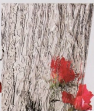
Ornamentglas Silvit 178 bronze