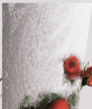
Silk weiß, geprägt