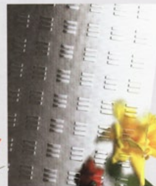
Royal Trio weiß