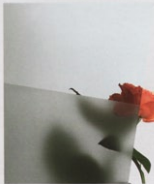
Parsol grau sandgestrahl (233)