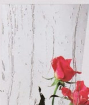
Ornamentglas Gotik weiß (238)