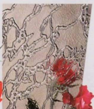
Ornamentglas Delta bronze