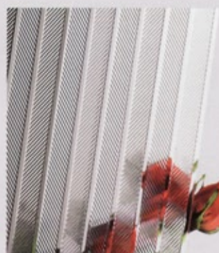
Royal Flash weiß