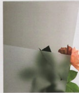
Stopsol grau sandgestrahl (246)