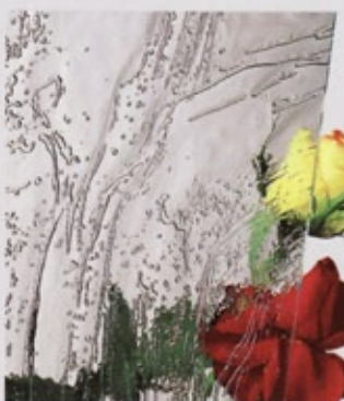
Ornamentglas Barock weiß