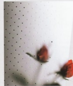
Pave weiß (243)