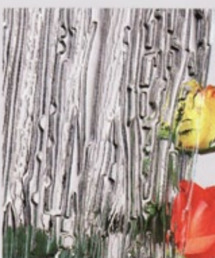
Ornamentglas Niagara weiß