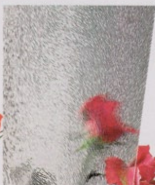
Ornamentglas Chinchilla weiß (272)