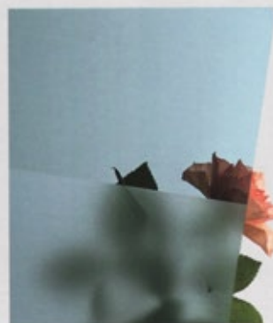
Stopsol blue sandgestrahl (247)