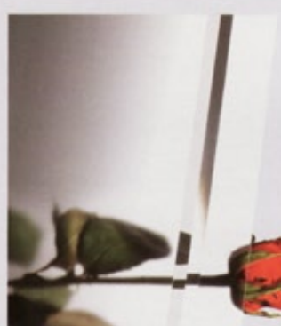
Reflo mit Schliffornamentik (286)